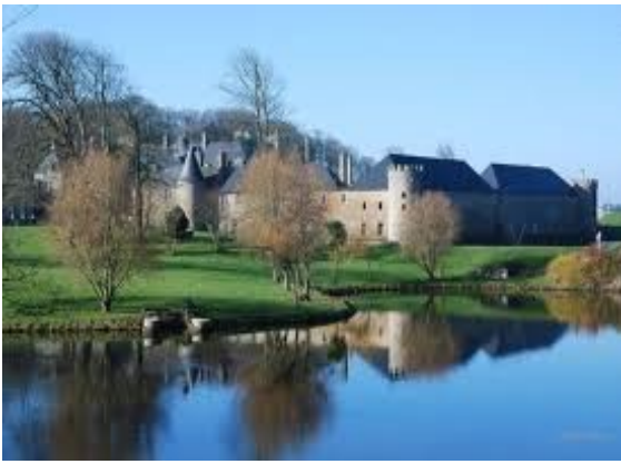
Flamanville Samedi 22 juin