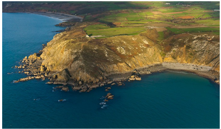
Nez de Jobourg Dimanche 23 juin